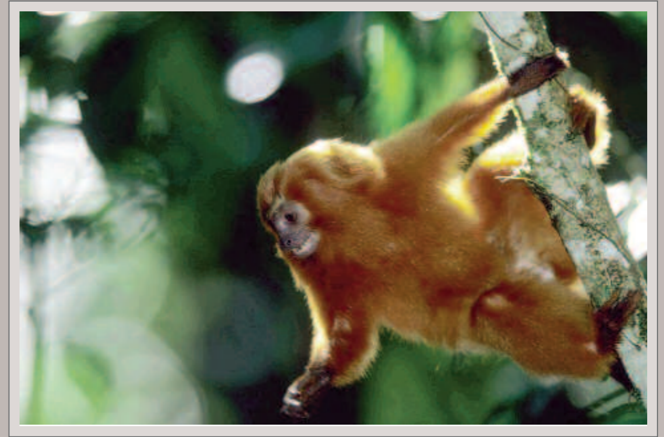
Löwenäffchen im Küstenregenwald nahe Rio de Janeiro. Nikon F5, Nikkor AF-S 2.8/400 mm, Aufhellblitz, Fujichrome Velvia 50