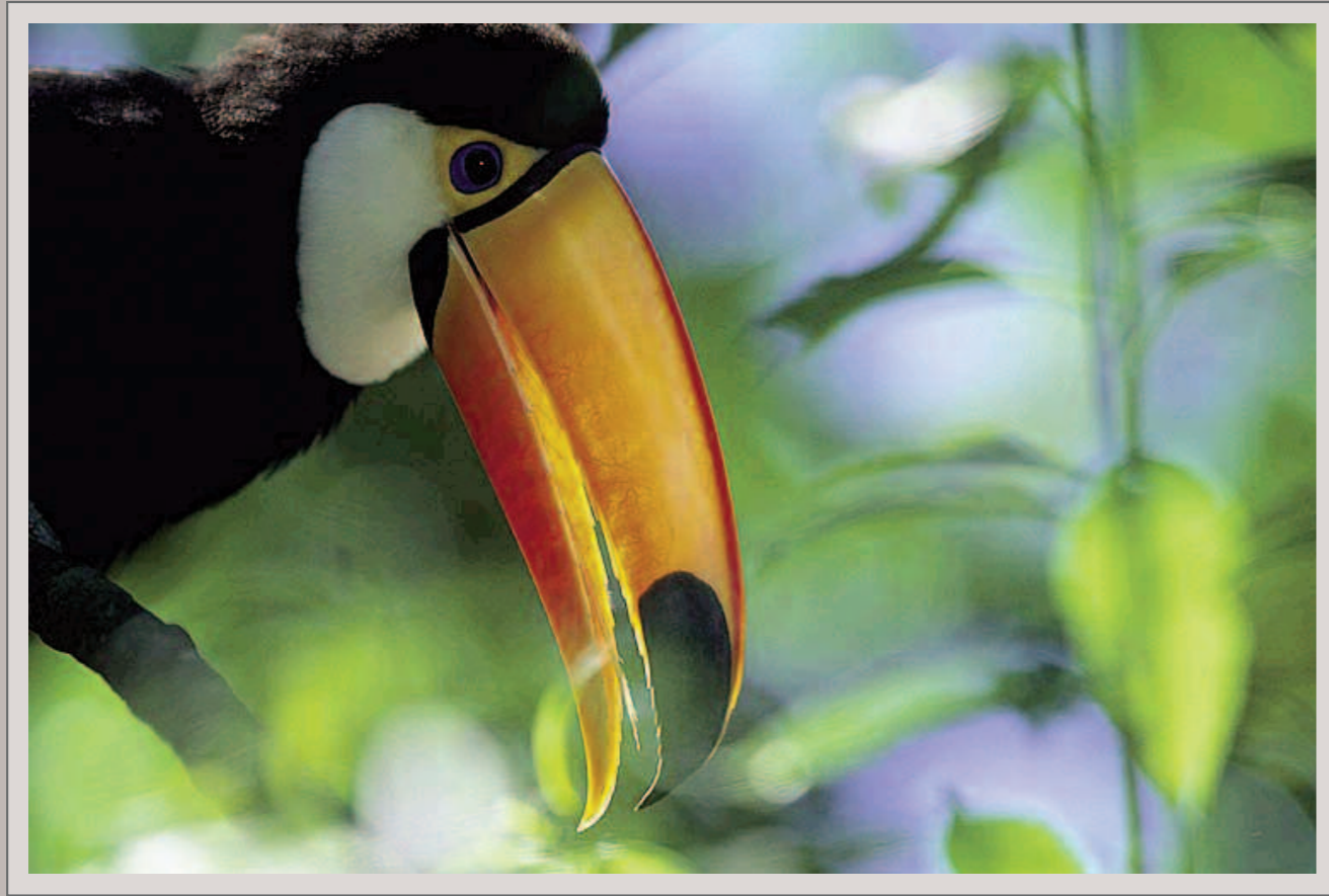
Riesentukan, Pantanal. Nikon F5, Nikkor AF-S 4/500 mm, Fujichrome Velvia 50