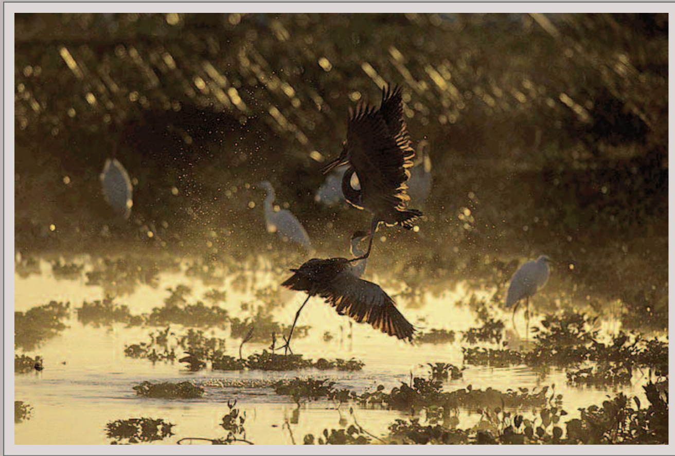
Versammlung von Reiher in einer Überschwemmungszone im Pantanal. Nikon F5, Nikkor AF-S 2.8/400 mm, Fujichrome Velvia 50