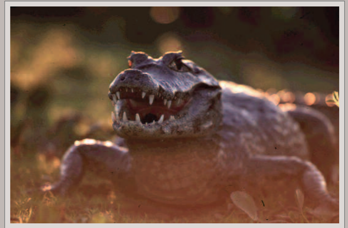
Brillenkaiman beim Sonnenbad, Pantanal. Nikon F6, Nikkor AF-S 2.8/400 mm, Fujichrome Velvia 50