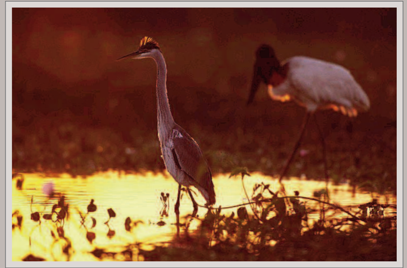
Cocoi-Reiher und Jabiru in einer Überschwemmungszone im Pantanal. Nikon F5, Nikkor AF-S 2.8/400 mm, Fujichrome Velvia 50