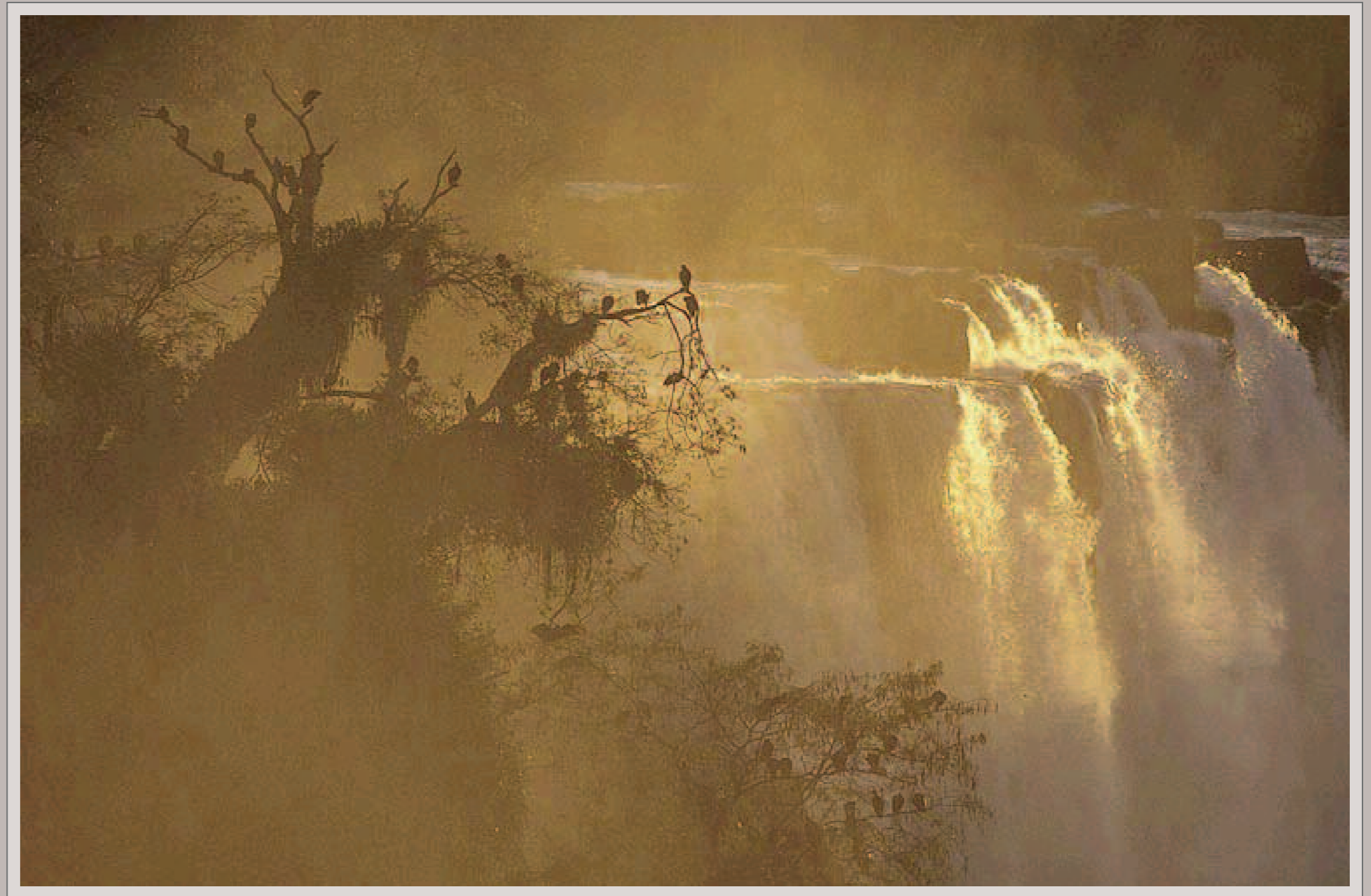
Die Wasserfälle von Iguacu. Nikon F5, Nikkor AF-S 2.8/80-200 mm, Fujichrome Velvia 50

Die Bilder im Portfolio geben einen kleinen, wenngleich besonders stimmungsvollen Einblick in die Vielfalt der brasilianischen Natur. Von den Iguacu-Fällen über das gewaltige Feuchtgebiet des Pantanal bis hin zu den äußerst bedrohten atlantischen Regenwäldern zeigt Berndt Fischer von ungewöhnlichen Lichtstimmungen geprägte Natur-Impressionen. Weitere Informationen zu Berndt Fischer und seinen Bildern gibt es auf der Website des Fotografen unter www.berndtfischer.com .